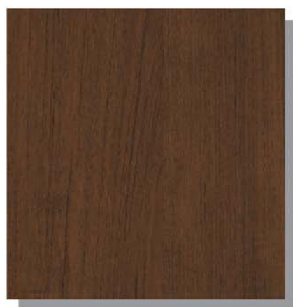
YF: キャラメルチーク

時間を経て生み出される深い味わいのチーク柄。素朴で表情豊かな木目が、確かな存在感を与えます。