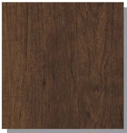
KX: ラスティックウッド

深みのある色合いと、なめらかで美しいウォールナット柄が、上質で重厚感漂う空間を演出します。