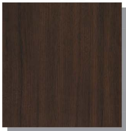
Z9: ショコラウォールナット

深みのある色合いと、なめらかで美しいウォールナット柄が、上質で重厚感漂う空間を演出します。